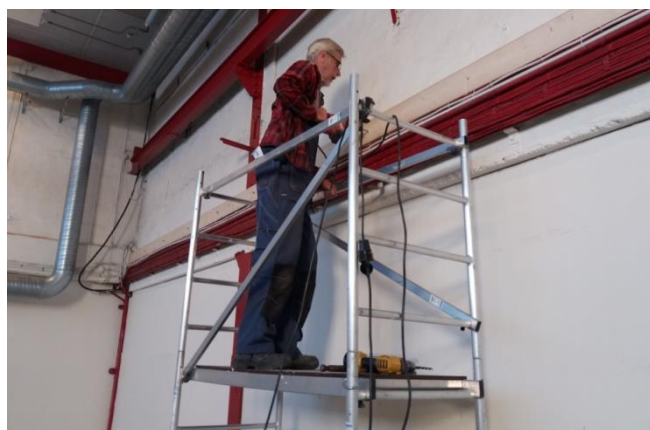
Arbetet med att bygga entresolplanet började med montering av balkar på bakväggen.