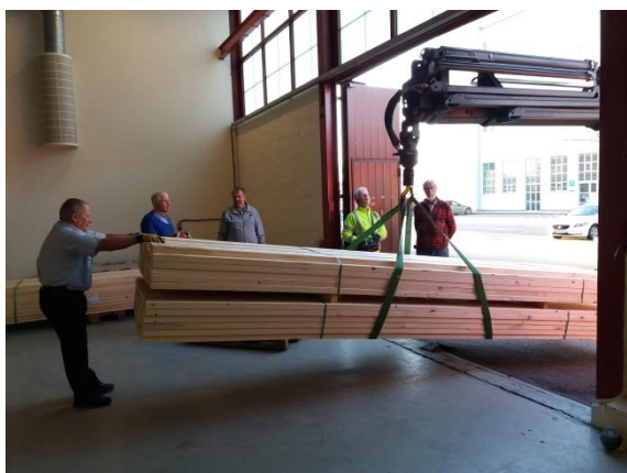
Måndagen den 2 januari kom leveransen av virket övervakad byggmästaren själv (till höger)

Detta för att byggmästaren (undertecknad) skulle kunna planera ombyggnaden och anpassningen av lokalerna så att byggnadsarbetet skulle kunna starta så snart som möjligt på det nya året. Lagerlokalen, som skall hysa själva anläggningen och åskådare, är 16 x 10 kvm och inte mindre än 6 m hög. Anslutande kontorslokal som har 4 rum, pentry, toalett och hall är på 95 kvm. Den höga höjden i lagerlokalen samt traversbalkar i taket innebar att vi kunde planera in ett hängande entresolplan på 3,2 m höjd utan pelare med måtten 4,5x16 kvm som är tänkt att tjäna som klubblokal och bibliotek. Totalt får vi alltså en yta på totalt 327 kvm jämfört med ca 210 i gamla lokalen.