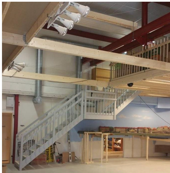
Den eleganta trappen upp till entresolen