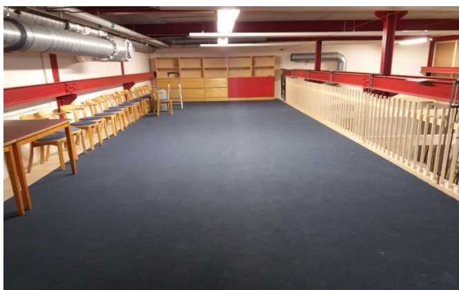
Så här elegant har det blivit på entresolen