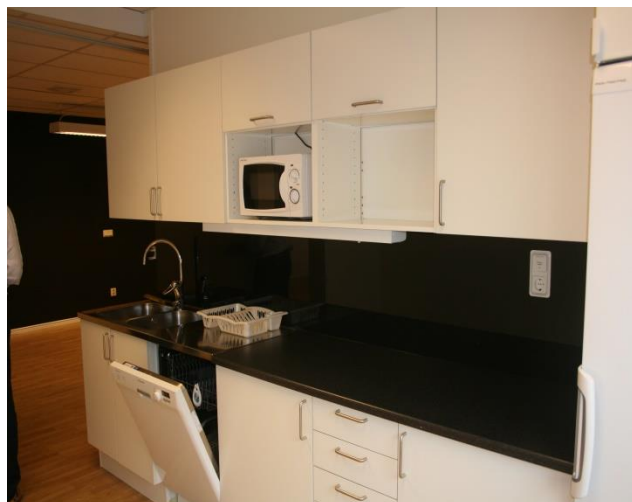
Nu har vi äntligen fått toalett och ett modernt kök