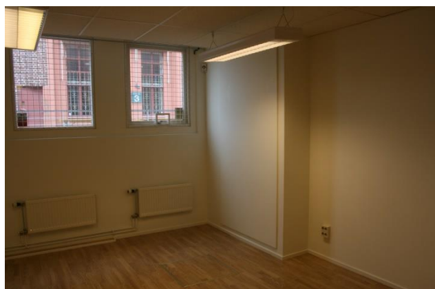
Vår blivande verkstad. Vi har både larm och galler för fönstren.