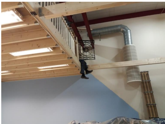
Ralph bygger reservutgången från entresolplanet