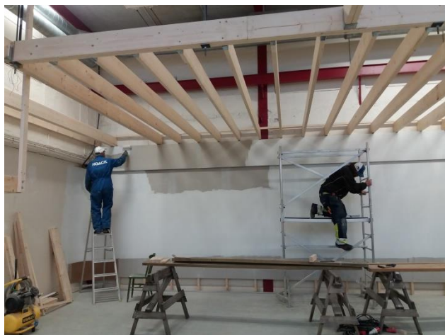
Målning av fondväggen